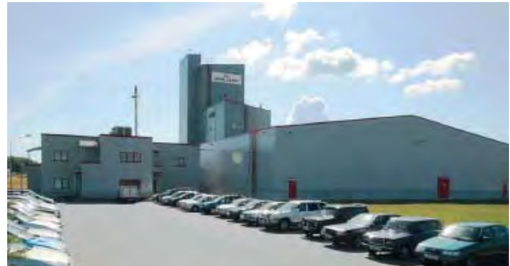
Производственно-складской комплекс завода ROYAL CANIN