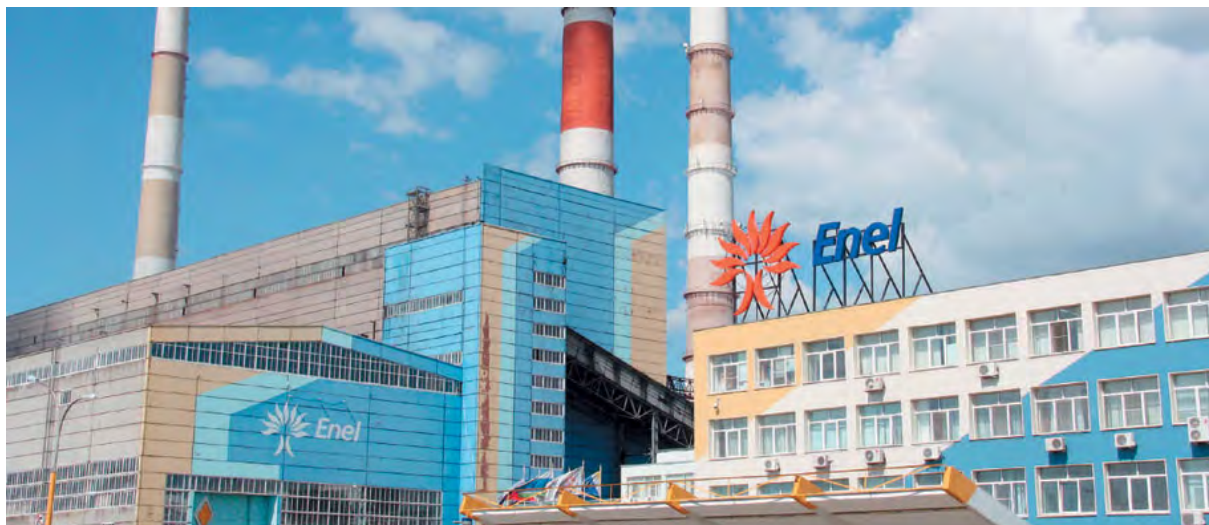
Филиал Рефтинская ГРЭС ОАО «Энел ОГК-5»