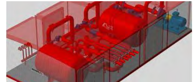
Станции пожаротушения блочно-модульные