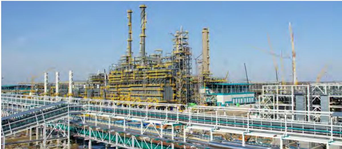
«Тобольск-Полимер» - комплекс производства полипропилена (ПП)