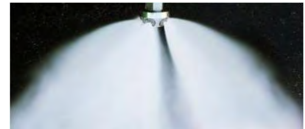
Системы водяного пожаротушения и ТРВ высокого давления EI-MIST®