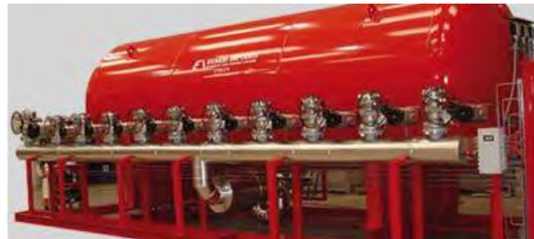
Модули изотермические с CO 2 (МИЖУ)