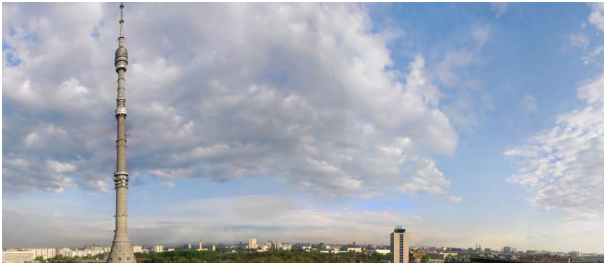
Останкинская телевизионная башня

Заказчик: ФГУП «Российская телевизионная и радиовещательная сеть»