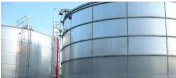
Резервуары противопожарного запаса воды стальные сборные