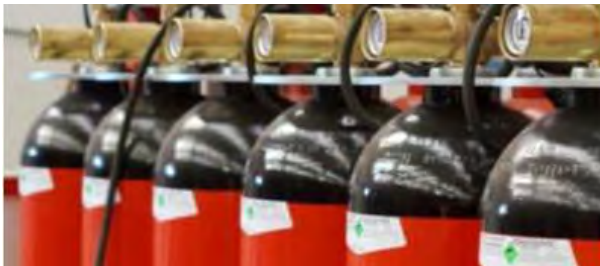
Системы газового пожаротушения