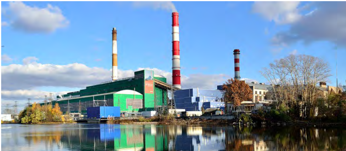
Филиал Шатурская ГРЭС ОАО «Э.ОН Россия»

Заказчик: Филиал «Шатурская ГРЭС» ОАО «Э.ОН Россия»